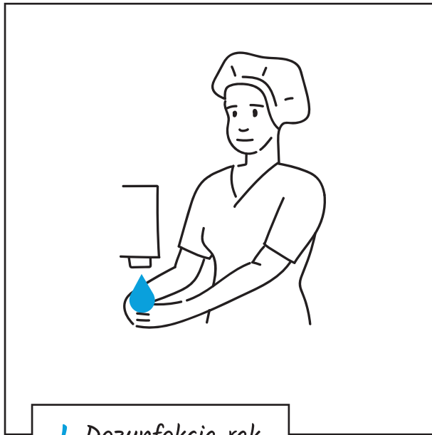
1. Dezynfekcja rąk

W czasie opieki nad pacjentami z podejrzeniem lub potwierdzonym zakażeniem wirusem SARS-CoV-2 (COVID-19).