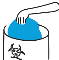
7. Umieszczenie fartucha w pojemniku