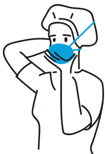
9. Ściągnięcie maseczki