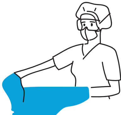
6. Ściąganie fartucha - ciągnięcie od siebie