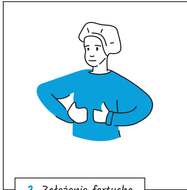
2. Założenie fartucha