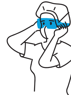
8. Ściągnięcie gogli