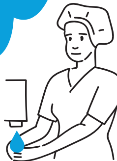
11. Dezynfekcja rąk