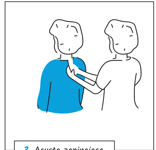
3. Asysta zapinająca fartuch z tyłu